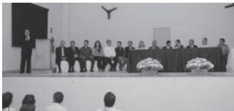
Composição da mesa durante solenidade de posse da Associação Comercial de Alfenas